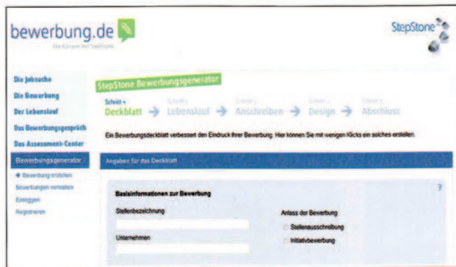
Der Generator führt in einer halben Stunde zu einer vollständigen Bewerbung

Auch optisch unterscheiden sich die vom Generator erstellten Bewerbungen. Mithilfe des Tools sind theoretisch 72 500 verschiedene Bewerbungen in fünf unterschiedlichen Designs möglich – darüber hinaus lässt sich das Anschreiben auch frei editieren.