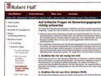
Der Umgang mit kritischen Fragen lässt sich üben

Während eines solchen Interviews kommt es auf jede Kleinigkeit an, denn der Gesprächspartner registriert einfach alles: die sachliche Argumentation ebenso wie die Art der Selbstdarstellung. Gerade Letzteres sollten Bewerber nicht unterschätzen; der persönliche Eindruck ist ei-