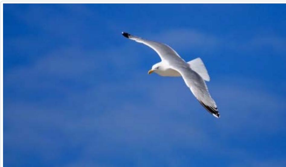
Nichts geht über die Freiheit - finden IT-Freiberufler.